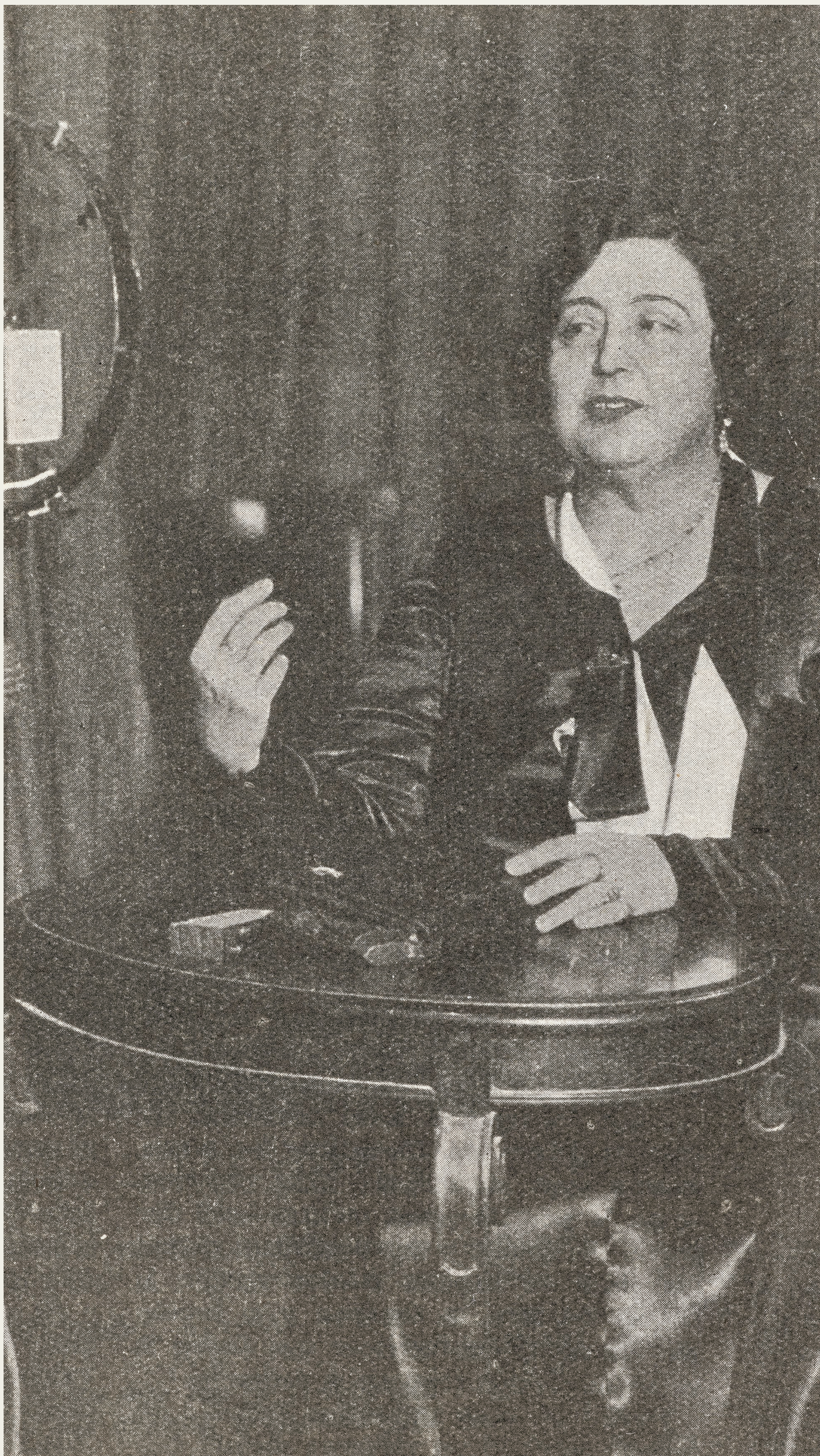
«A través del micrófono», Ondas , 11-VII-1931. Biblioteca Nacional de España, ZR/717.