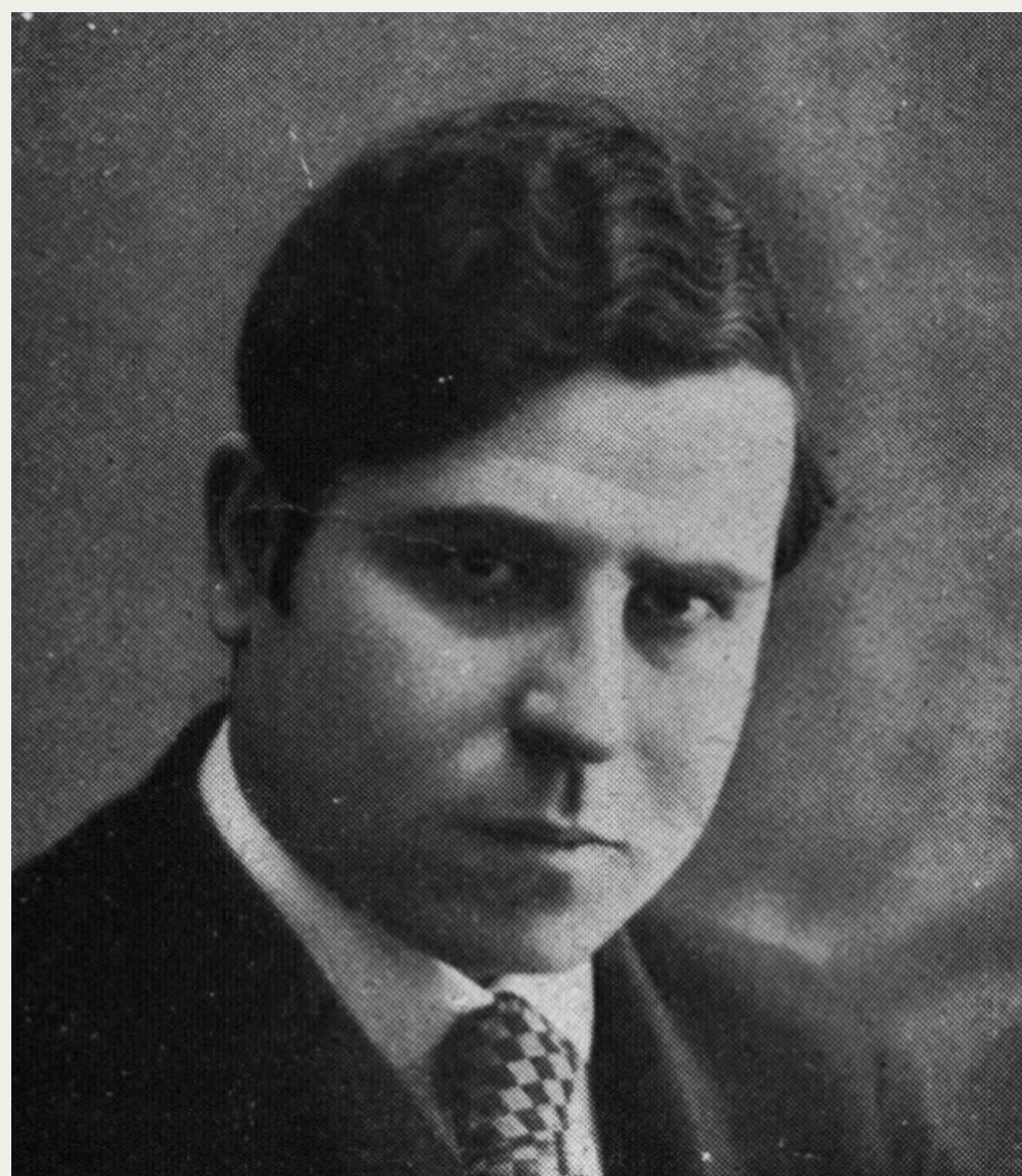
Retratos de Carmen de Burgos y Ramón Gómez de la Serna en «La vida literaria. Tres libros interesantes», Nuevo Mundo , n.º 1404, 10-XII-1920. Biblioteca Nacional de España, AHS/43209.