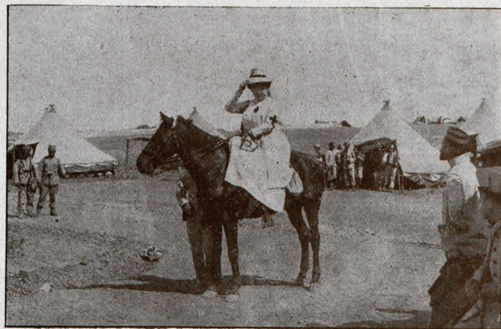
Carmen de Burgos à cheval dans le camp de Melilla.

«Notre Collaboratrice Carmen de Burgos (à Melilla, Maroc)», Parigina Revue, Pa- ris. 25-XI-1909. Gallica. BNF. Biblioteca Nacional de Francia.