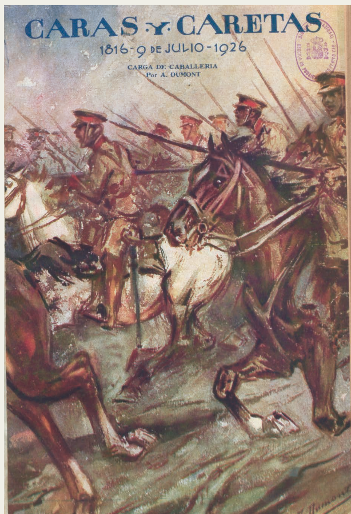
Portada, Caras y Caretas , n.º 1449, 9-VII-1926. Biblioteca Nacional de España, ZR/948.