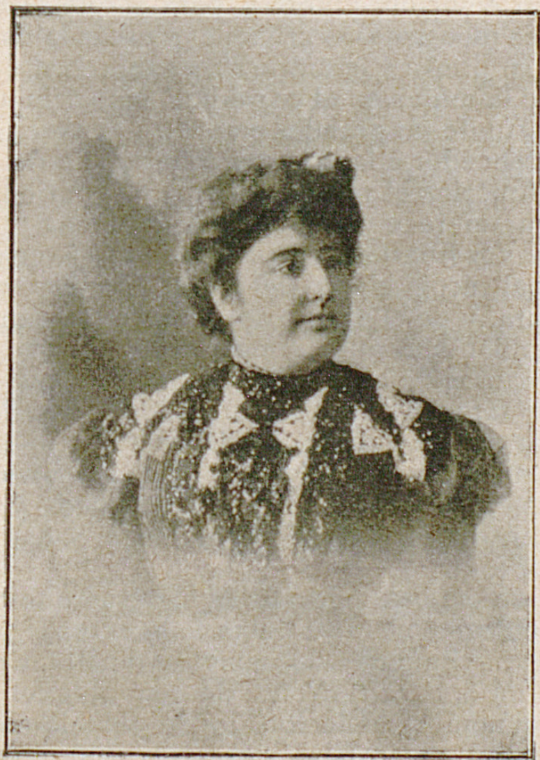
Sra. D. a Carmen de Burgos Seguí (Colombine).

Nosotros, que la admiramos y estimamos en lo mucho que vale, queremos consignar aquí que tenemos la esperanza de que llegue á ser en las letras patrias una de las más conspicuas escritoras.