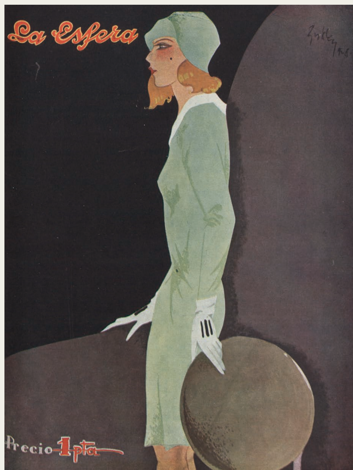
Portada, La Esfera , n.º 771, 13-X-1928. Biblioteca Nacional de España, AHS/35356.