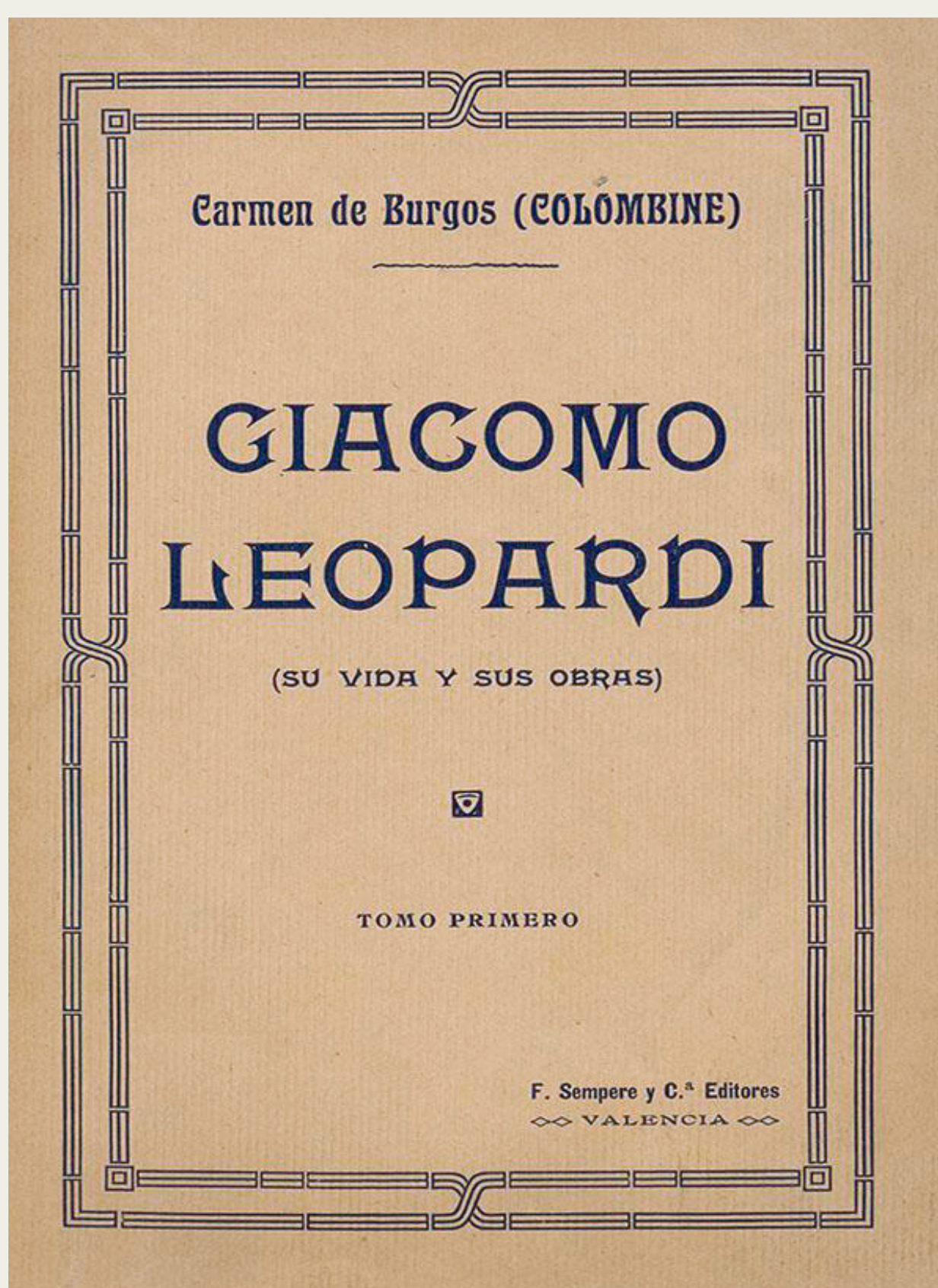
Carmen de Burgos. Giacomo Leopardi (su vida y sus obras) , Sempere, Valencia, 1911, 2 vols. Biblioteca Nacional de España, 1/58554 V.1 - 1/58555 V.2.

Supo aunar pensamiento y acción. Solicitada por el prestigio de su figura, presidió organizaciones feministas nacionales e internacionales: desde 1920, la Cruzada