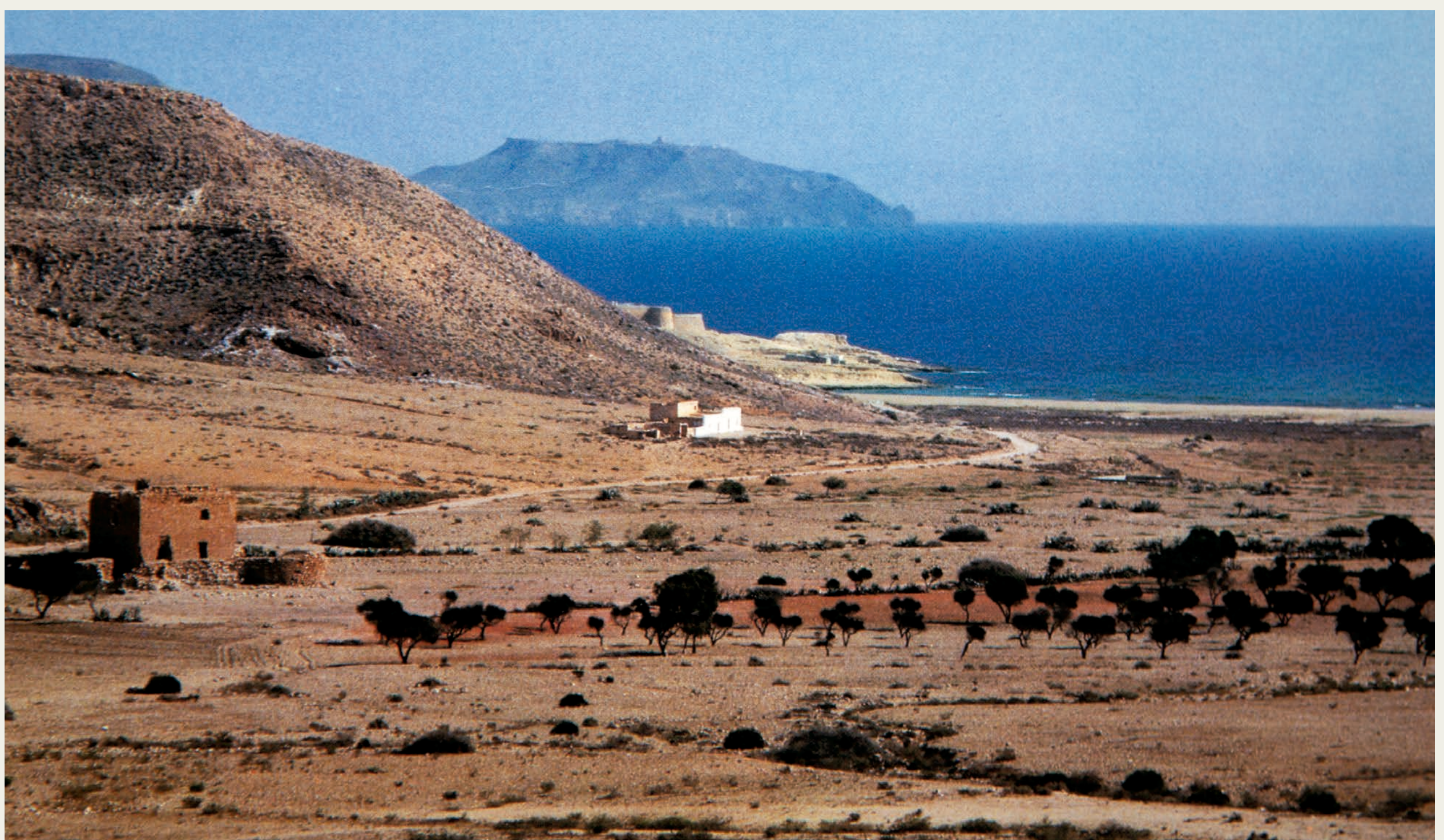
Fotografía de Rodalquilar en la salida al mar.

Desde Almería, su tierra natal, llegó a Madrid en 1901 y muy pronto, en enero de 1903, se convirtió en la primera redactora de un periódico ( Diario Universal ) con la columna diaria “Lecturas para la mujer”, que firmaba con el seudónimo de Colombine . En otoño de 1905, pasó a ser “Femeninas” en Heraldo de Madrid . Con los años, publicó millares de artículos en las