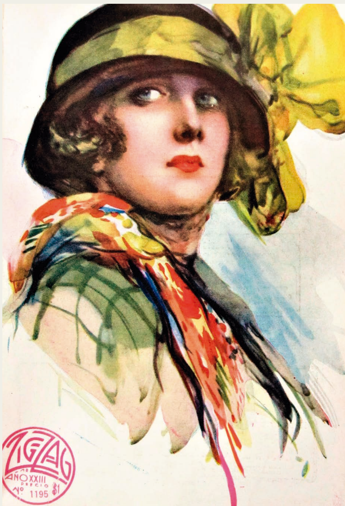
Portada de Zig-Zag, año XXIII, n.º 1195.