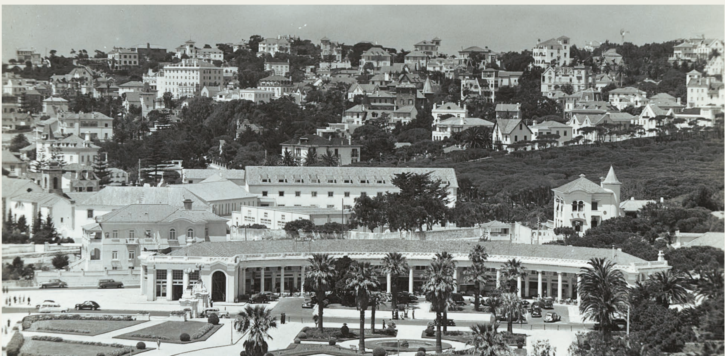
El Ventanal, detrás de la arcada de poniente en Estoril, Archivo Histórico Municipal de Cascais.

Como escritora, nació con un impulso noventayochista y evolucionó en contacto con todas las corrientes que se sucedieron a lo largo del primer tercio del siglo xx, desde sus vínculos con los narradores realistas, o con los escritores modernistas, hasta su participación en la corriente vanguardista encabezada por Ramón Gómez de la Serna, quien durante más de veinte años se convirtió en su compañero sentimental.